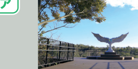
20 魔女の谷のみえる展望台