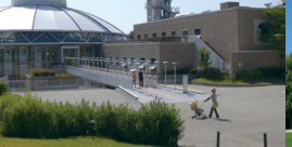
9 愛知県児童総合センター