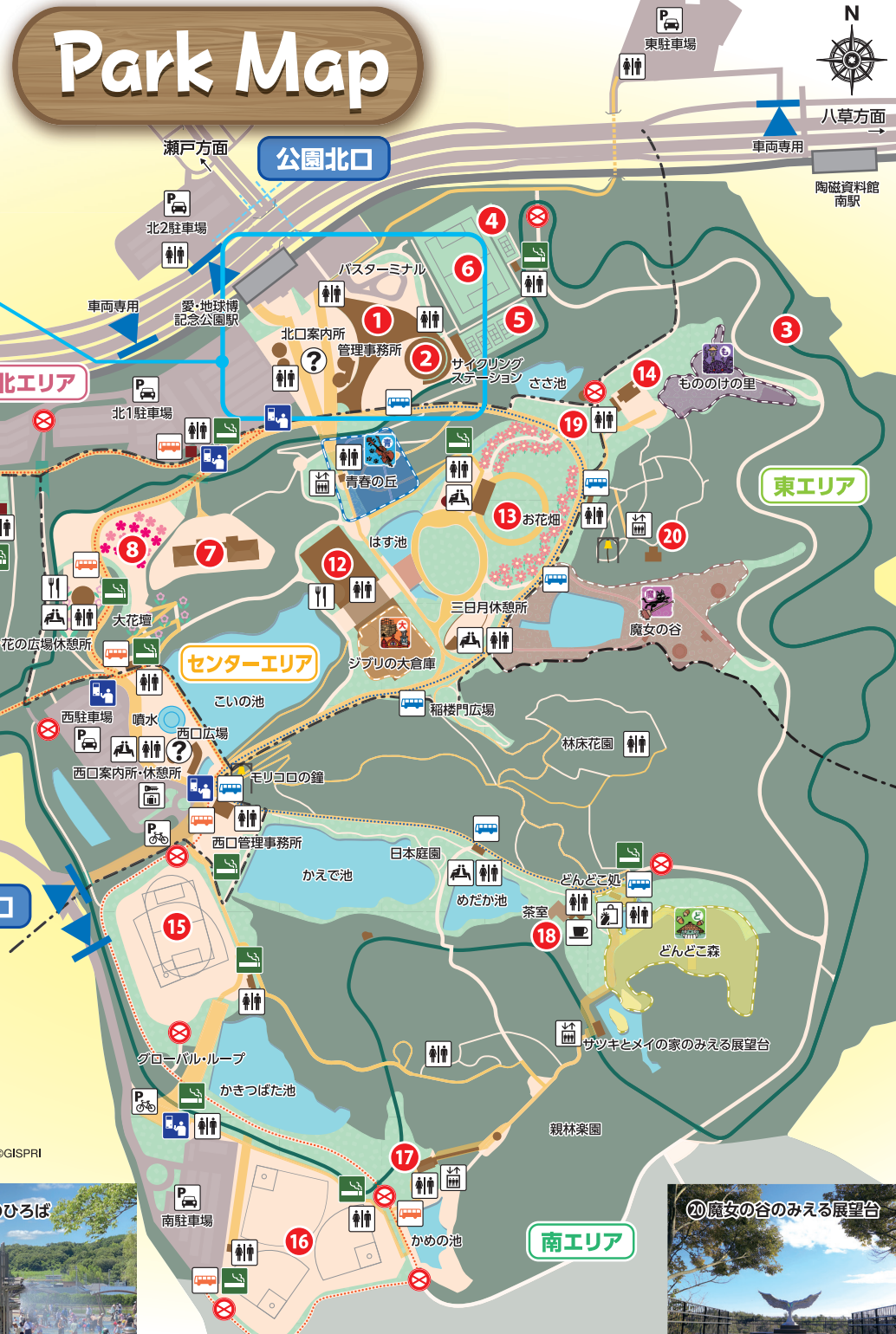
12 アイススケート場